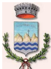
Comune di Tremosine