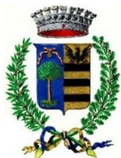
Comune di Gardone Riviera

FEDERAZIONE REGIONALE ORDINI DOTTORI AGRONOMI DOTTORI FORESTALI DELLA LOMBARDIA